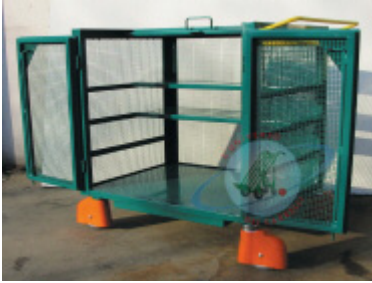
Ante ad apertura totale

A richiesta è possibile realizzare il carrello con esclusione del sistema frenante.